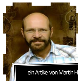
ein Artikel von Martin Hüfken (Sozialtherapeut und Militärpfarrer)

Die Psychotherapie mit ihrem ganzheitlichen Verständnis vom Menschsein geht davon aus, dass der Mensch nicht eine Seele hat, sondern eine Seele ist. So wird also die Sorge um Menschen, auch im säkularen Bereich, Seelsorge genannt. Sie muss unterscheidbar sein in